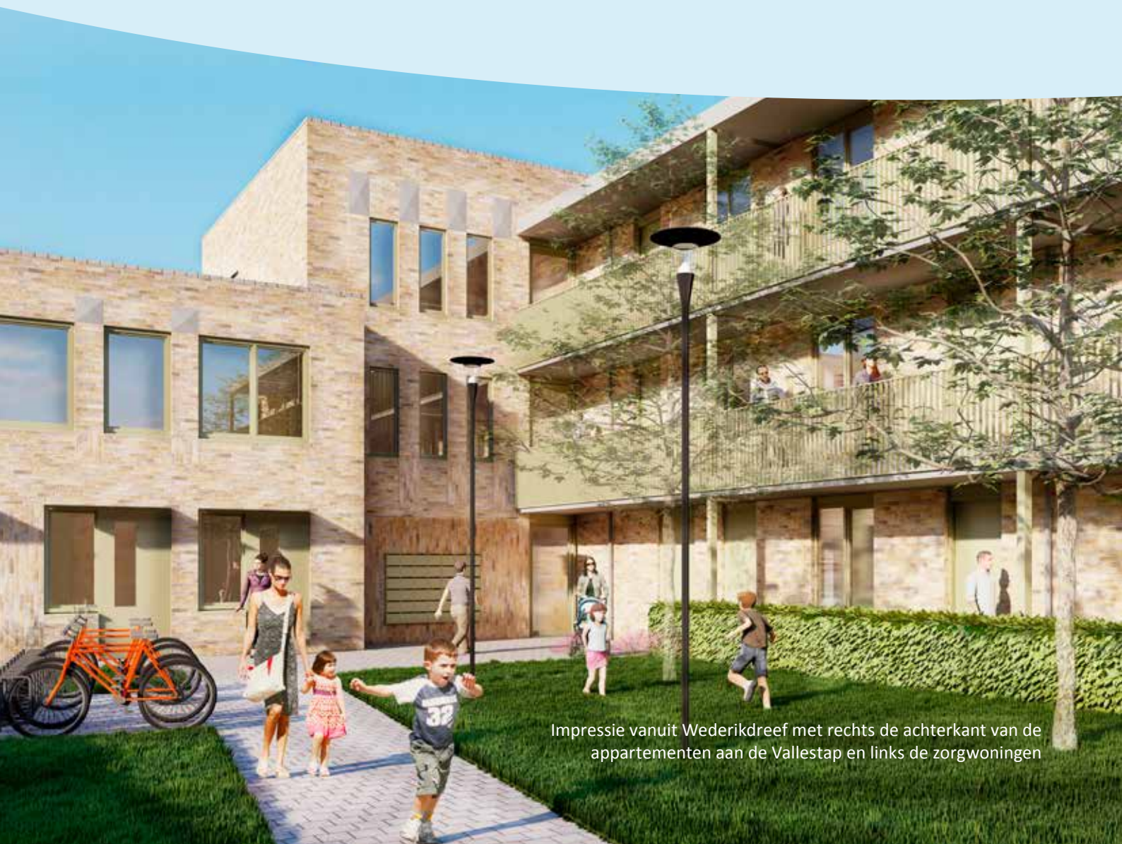
Impressie vanuit Wederikdreef met rechts de achterkant van de appartementen aan de Vallestep en links de zorgwoningen

Als u uw woning wilt aanpassen aan uw persoonlijke smaak, geven wij u daarvoor de ruimte. Er is een aantal (wettelijke) regels waaraan u zich moet houden als het gaat om het aanpassen van uw woning. Neem altijd eerst contact op met Helpt Elkander of kijk op onze website als u van plan bent iets te veranderen in of aan uw appartement. Wij helpen u graag verder.