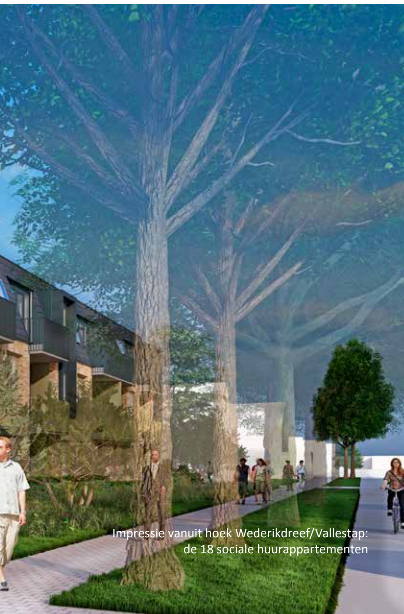
Impressie vanuit hoek Wederikdreef/Vallestep: de 18 sociale huurappartementen