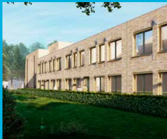
Impressie vanuit Sleedoornlaan: de 23 zorgwoningen voor Lunet

De 23 zorgwoningen (op de tekening bruin ingekleurd) zijn bestemd voor cliënten van Lunet met een zorgvraag. Deze woningen worden door Lunet toegewezen. Dat gaat buiten Helpt Elkander om. Als u vragen heeft over de zorgwoningen, neemt u dan contact op met Lunet via telefoonnummer (088) 551 50 00.